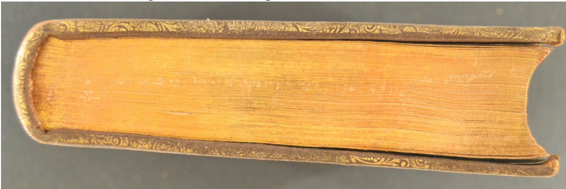
A.M.Y.VII.27-2, controguardia anteriore, particolare.